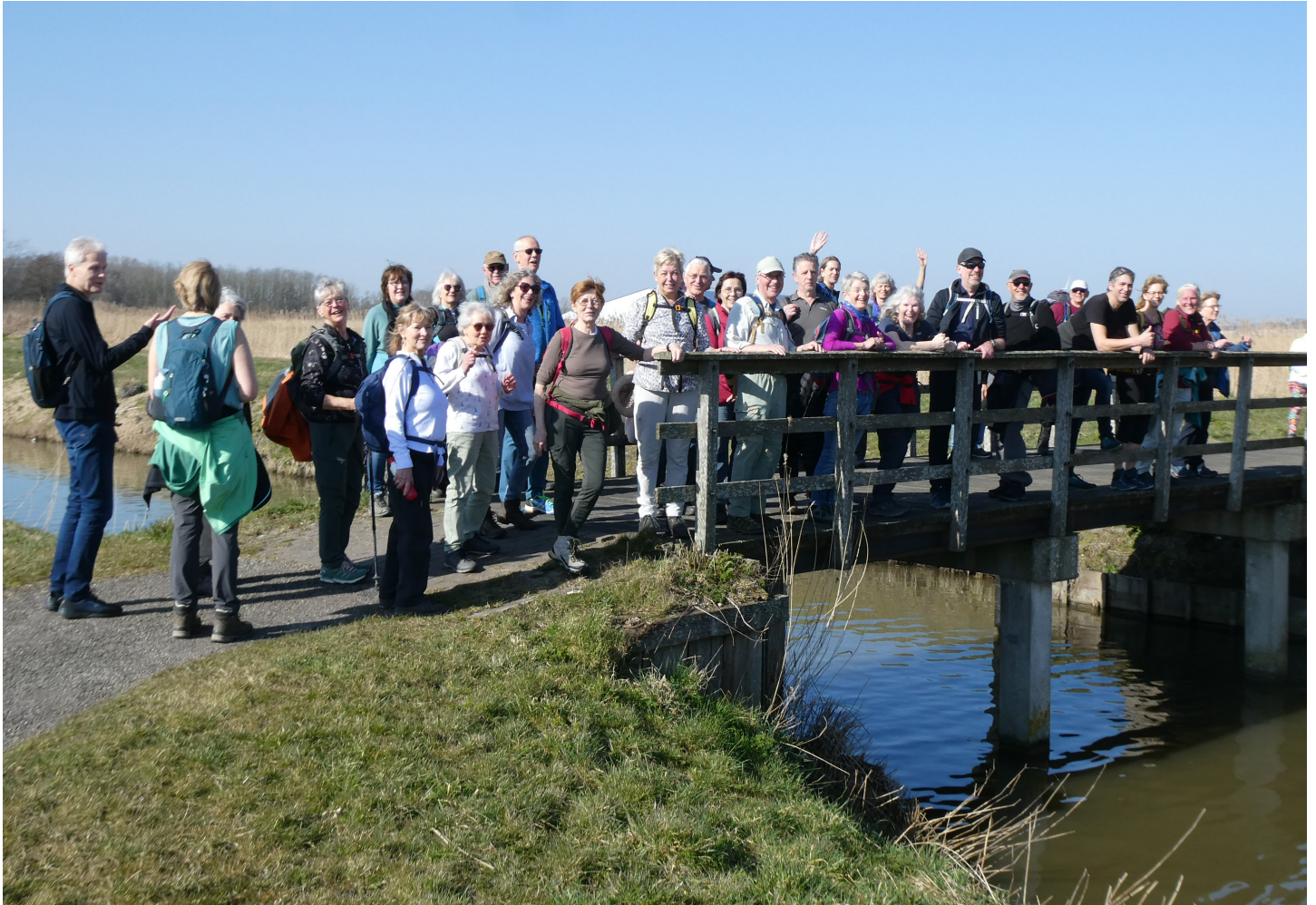
Groepsfoto in natuurgebied 'De Weelen'