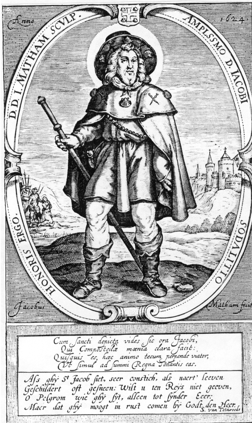
Afbeelding van de heilige Jacobus als pelgrim. Gravure door Jacob Matham, 1624.

Utrechtse universiteit. 68 Kennelijk waren er nog pelgrims in zijn tijd aan wie hij zijn woorden kon richten.