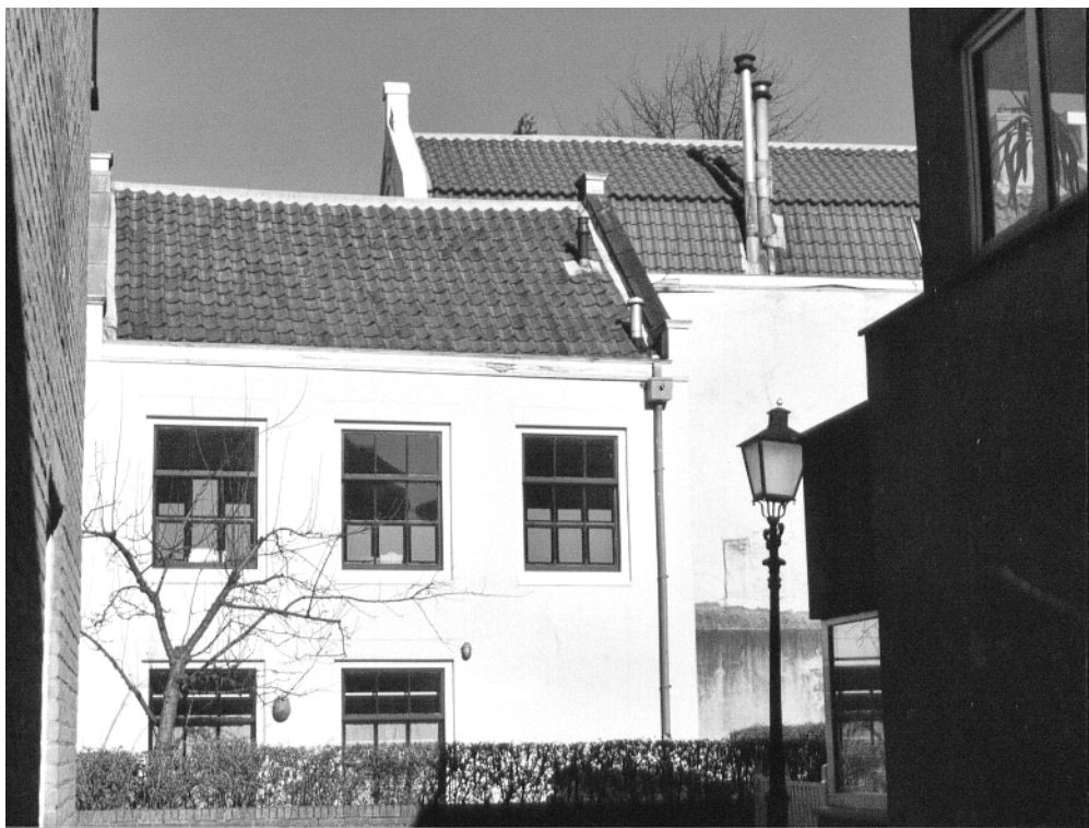
Jacobsgasthuissteeg 23. Foto Gerard Luiten, 2002.

Het pand Oudegracht 213 bevatte een eetzaal, de “refectiekamer” genoemd, een kapel en het eigenlijke gastenverblijf. Van de kapel uit de vijftiende eeuw waren nog delen van het houten tongewelf bewaard; bij de restauratie zijn de twee resterende spanten vernieuwd. Kipp noemt de spanten qua datering “gothisch”, wat helaas geen verdere precisering toelaat. 39 De kapel strekte zich waarschijnlijk uit van de eerste verdieping tot in de kap. Volgens Kipp moet de eetzaal achter de kapel hebben gelegen. De sleutelstukken van de balklaag op de begane grond wijzen op een verbouwing in de zestiende eeuw. Pas nadien moet de steeg door het pand heen naar de Oudegracht zijn doorgetrokken. In de bij het gasthuis horende Jacobsgasthuissteeg stonden tien woningen, zogeheten Godscameren. Het gasthuis verhuurde deze woningen als bron van inkomsten. Het pand Jacobsgasthuissteeg 1 is in 1977 gerenoveerd.