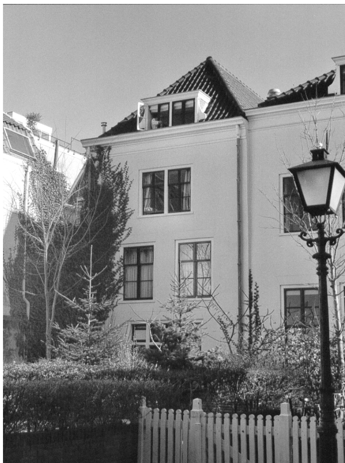
De achterkant van het Jacobsgasthuis, Oudegracht 213.