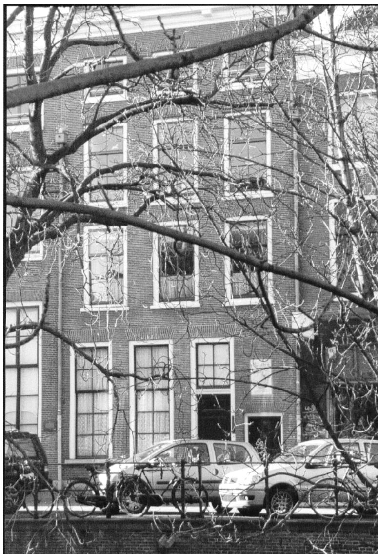
Jacobsgasthuis, Oudegracht 213. 2002.

De restauratie van het gasthuis in 1977 is niet behandeld in de afleveringen van de Archeologische en Bouwhistorische Kroniek van de Gemeente Utrecht . Het gasthuis lijkt in de huidige staat met het dak evenwijdig aan de Oudegracht een dwars huis van drie verdiepingen achter een gevel uit de achttiende eeuw. Het pand staat echter dwars op de gracht en heeft twee verdiepingen. Behalve een gewone kelder is er een werfkelder. Binnen zijn er nog resten van de gasthuiskapel aanwezig. De kap van het huis dateert uit de vijftiende eeuw. 3 In de Jacobsgasthuissteeg staat nog één oorspronkelijk middeleeuws huis, nr. 23, dat over de steeg heen is gebouwd, en een woning uit de achttiende eeuw, een tuinhuis, nr. 13. Na afbraak van de vervallen overige middeleeuwse panden in de steeg zijn in 1977 de andere woningen gebouwd. 4