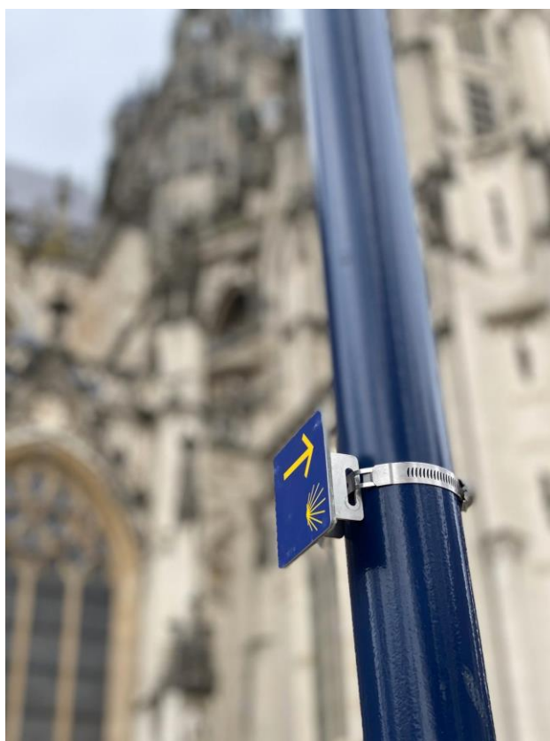
Wegwijzer bij de Sint Jan in Den Bosch, foto:Maarten Hoek