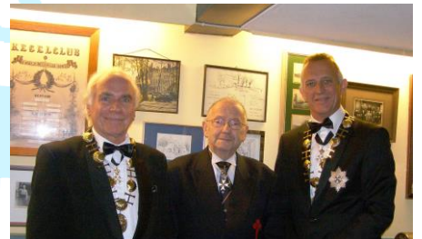
Het Bestuur van de Orde

Dit artikel is ingestuurd door: Albert de Bruijn , GMSJ