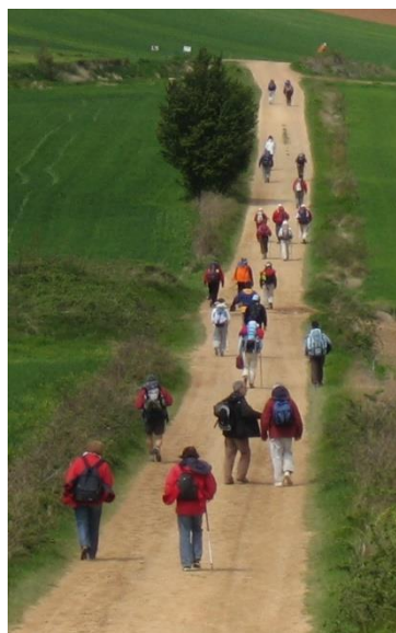
Drukke Camino Francés

Begin juni vond in Santiago een bijeenkomst plaats van genootschappen uit de hele wereld. Uiteraard was ook ons genootschap hier vertegenwoordigd. In de Jacobsstaf van het derde kwartaal zal hieraan een artikel worden gewijd.