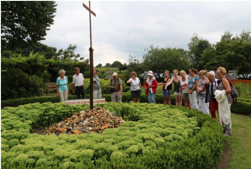
Het Cruz de Ferro van Vessem

Onder de naam Camino in de Kempen wordt op zaterdag 25 juli a.s. door de vrijwilligers van pelgrimshoeve Kafarnaüm, de Jacobushoeve en het Nederlands Genootschap van Sint Jacob (afdeling zuidoost) een wandeltocht georganiseerd. Ook van 2006 t/m 2014 werd deze wandeling in de mooie natuur tussen Vessem, Wintelre en Hoogeloon gehouden.