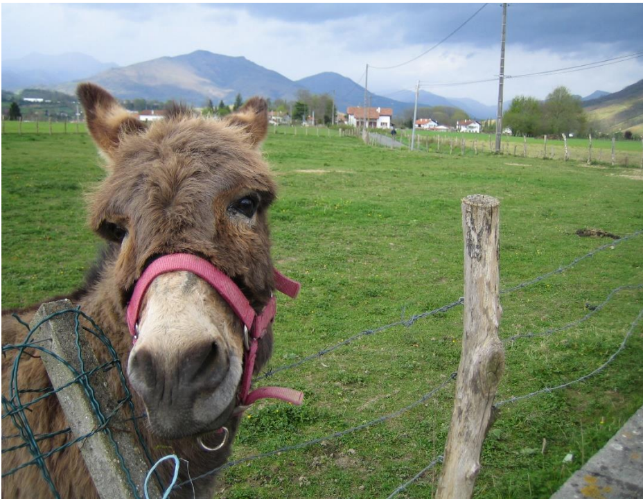
Route langs de voet van de Pyreneeën

De aanlooproute kan interessant zijn voor pelgrims die eigenlijk hun Camino in Saint-Jean-Pied-de-Port willen starten, maar er tegen opzien de eerste dag meteen de oversteek van de Pyreneeën te moeten maken. In plaats daarvan kunt u eerst naar Saint-Palais reizen en vandaar op uw gemak, in twee dagen, naar Saint-Jean lopen. Onderweg kunt u genieten van de prachtige omgeving, terwijl u went aan het lopen in de heuvels en aan het gewicht van uw rugzak. Meer informatie over de reis, de wandeling (routebeschrijving en kaartjes) en de overnachtingsmogelijkheden vindt u op Inlooproute Saint-Palais naar Saint-Jean-Pied-de-Port .