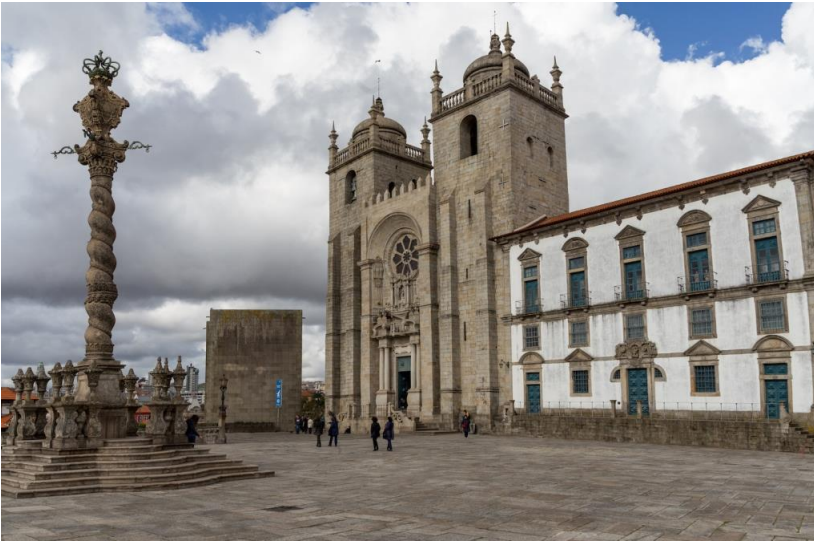
Sé Cathedral in Porto, voor velen het startpunt van de Camino Portugués

Onlangs liep ik de Camino Portugués vanuit Coimbra naar Santiago de Compostela. Daarna ben ik nog doorgeslagen naar Finisterre en Muxía. Net als het afgelopen jaar op de Francés had ik mijn professionele spiegelreflex camera met twee lenzen meegenomen en ik heb ondanks het regenachtige weer vele foto's gemaakt. Graag wil ik deze foto's delen met andere pelgrims. Daarom stel ik de foto's vanaf mijn website - voor persoonlijk gebruik - gratis