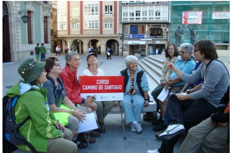
Cursisten in Lugo

Veranderingen in Santiago de Compostela, herbergen, lezingen, studiedagen, boeken concerten en andere voorstellingen.