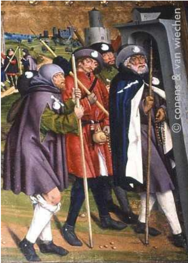
Detail van altaarstuk ca. 1460 in de J-kerk in Rothenburg o/d Tauber