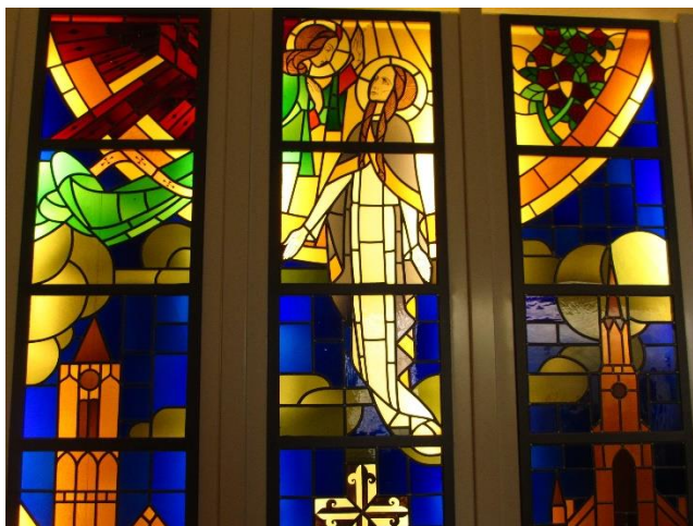
Liduinajaar in het glas-in-lood-raam van het verpleeghuis Frankeland te Schiedam

De regio Rotterdam houdt op 18 april 2015 haar voorjaarsbijeenkomst. Dit keer geen lange wandeling of fietstocht, maar een bijeenkomst met een meer cultureel karakter: we gaan naar Schiedam en sluiten ons aan (op verzoek van de gemeente Schiedam) bij activiteiten in het kader van het Liduinajaar. We hebben in afstemming met de gemeente een interessant programma samengesteld. Zie voor informatie over het Liduinajaar ook