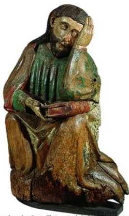
Jacobus, detail van Christus in de hof van Greisenane Worms?, ca. 1440 ABM bh367-570

Lezers die zelf ook schrijven, kunnen in deze rubriek hun boek onder de aandacht van de leden van ons Genootschap brengen (het is dus geen recensie van de redactie van Ultreia ).