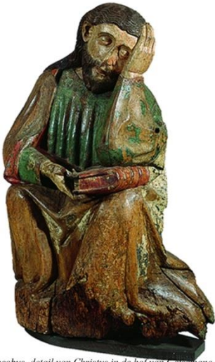
Jacobus, detail van Christus in de hof van Geisemane Worms?, ca. 1440 ABMbh567-570

Wij stellen het op prijs indien u een exemplaar van uw boek aan onze bibliotheek schenkt. Gaarne uw boek naar: Nederlands Genootschap van Sint Jacob t.av. Bibliotheek Janskerkhof 28a 3512 BN UTRECHT