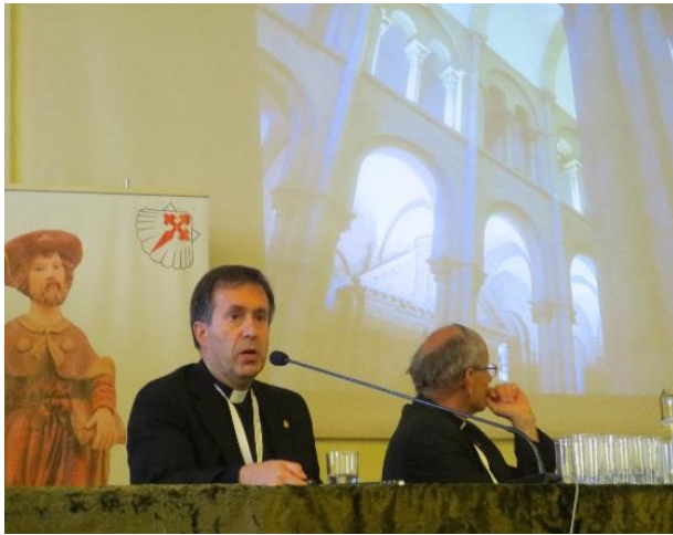
Foto: de secretaris van de curie in Santiago

te veel te laten overheersen. In Krakau was het precies tegenovergesteld, een kleine veertig internationale gasten en ongeveer zestig Polen, zodat het internationale wel eens wat ondersneeuwde, maar gelukkig werd het nog geen Poolse landdag.